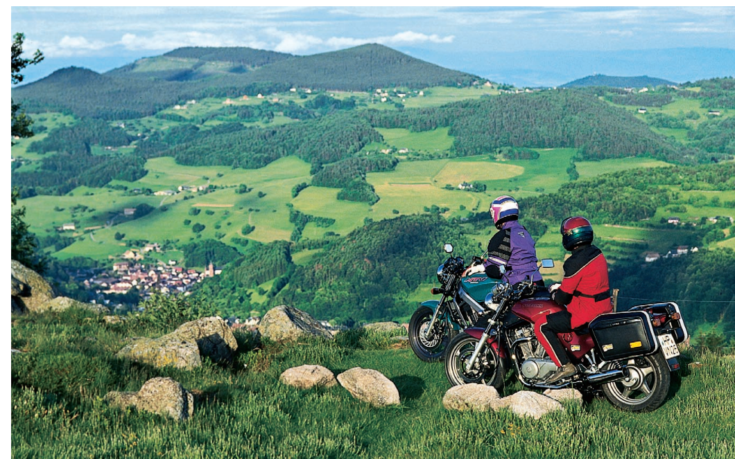
Von der »Route des Crêtes« geht der Blick über schier endlose grüne Hügellandschaften.

Von Sainte-Marie-aux-Mines führt das Val d'Argent, das Silbertal, nun auf die Höhen des »Col des Bagenelles« und des »Col du Bonhomme«. Dort rollen die Bikes dann auf der Vogesen-Kammstraße, der »Route des Crêtes«. Hände und Füße haben zwar gut zu tun, doch es geht auch mal ein Stück gerade-