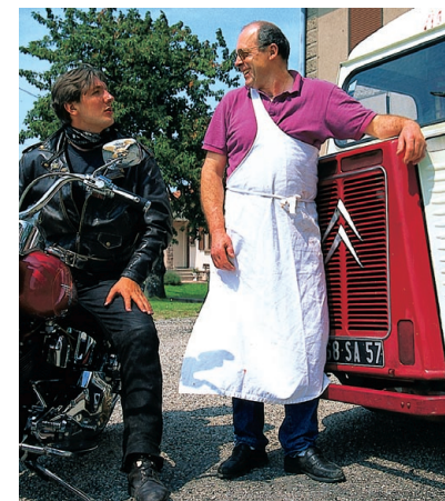
Der fahrende Metzger ist immer für ein Schwätzchen zu haben.