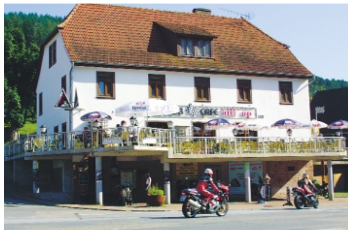
Eddi Edelstahls nicht rostendes »Hill up« im Örtchen Kailbach.